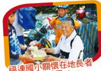
福連國小關懷在地長者 送愛的手工pizza 給社區長輩