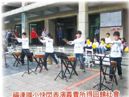
福連國小快閃表演義賣所得回饋社會

福連國小配合節慶活動，邀請卯澳、馬崗在地居民，親、師、生一起製作窯烤PIZZA分送社區年邁獨居長者並關懷問安。近年亦與喜憨兒基金會合作，由學校師生於中秋節送月餅給社區長者，關懷敬老、佳節傳愛。