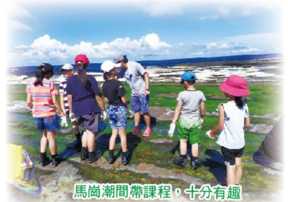
馬崗潮間帶課程，十分有趣

福連國小師生於每年春、夏季配合馬崗潮間帶生物生長週期，到馬崗海蝕平台進行潮間帶觀察探索課程。馬崗海蝕平台生態豐富，可觀察到石蓴、石花菜、陽隧足、螺類、海膽、海蛞蝓及海鞘等潮間帶動植物，馬崗潮間帶可說是福連國小得天独厚的大自然教室。