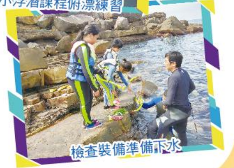
檢查裝備準備下水