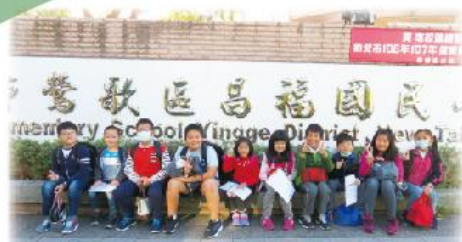
福連國小到鶯歌昌福國小， 體驗-陶藝與魚菜共生課程