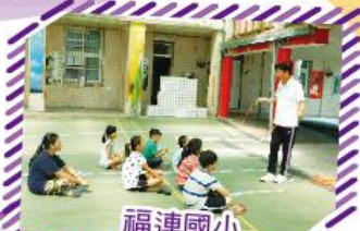
福連國小 花式跳繩授課中