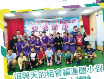
海與天的相會福連國小到 桃園陳康國小體驗 航空教育課程