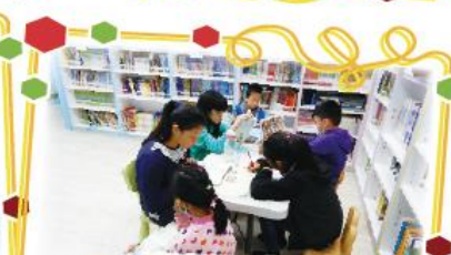
福連國小閱讀 列車圖書室靜心閱讀