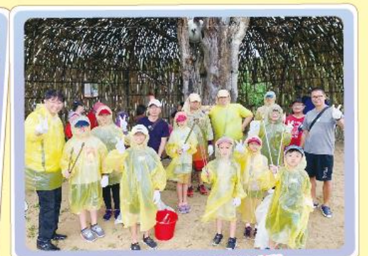
貢寮區學校聯合淨灘活動