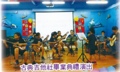
古典吉他社畢業典禮演出

福連國小發展多元特色社團，如AI程式設計、太鼓、潮流街舞、古典吉他、傳藝跳繩等，開