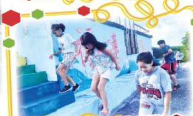
福連小課後運動社團 登階訓練