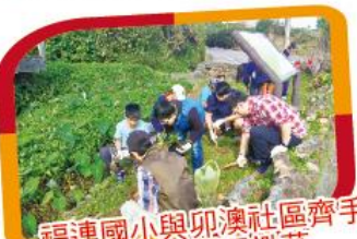
福連國小與卯澳社區齊手 為百合園區鋤草 為地方盡一份心力