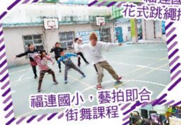
福連國小，藝拍即合 街舞課程