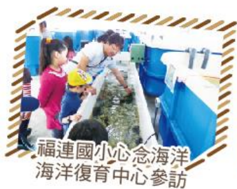
福連國小心念海洋海洋復育中心參訪