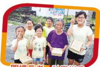
關懷長者，社區送愛 Pizza熱到家

福連國小配合節慶活動，邀請卯澳、馬崗在地居民，親、師、生一起製作窯烤PIZZA分送社區年邁獨居長者並關懷問安。近年亦與喜憨兒基金會合作，由學校師生於中秋節送月餅給社區長者，關懷敬老、佳節傳愛。