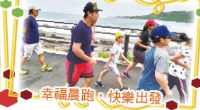
幸福晨跑，快樂出發