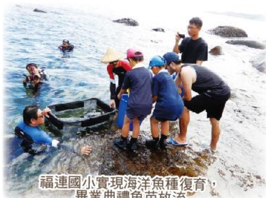
福連國小實現海洋魚種復育，畢業典禮魚苗放流

福連國小與東北角福隆教會合作，推動晨間英語課程，由教會聯繫國際志工到校教導英語及他國文化；與新北市政府漁業及漁港事業管理處及國立海洋大學定期合作，進行魚苗復育及九孔、花枝放流活動，維護在地漁業資源與環境生態保育。