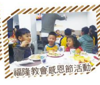
福隆教會感恩節活動