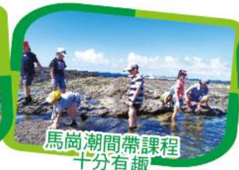
馬崗潮間帶課程十分有趣