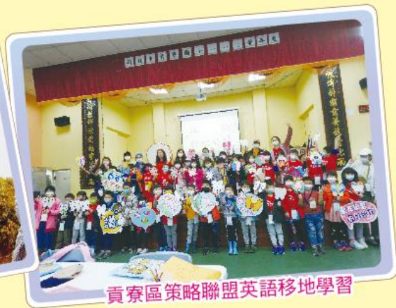
貢寮區策略聯盟英語移地學習