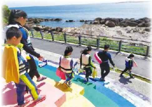
福連國小彩虹階梯下方即是天然潮池