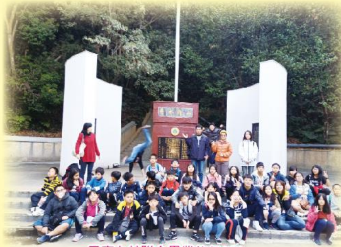
貢寮九校聯合畢業旅行(二)