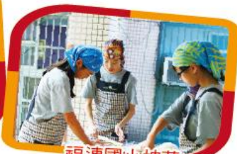
福連國小披薩 義賣行善活動