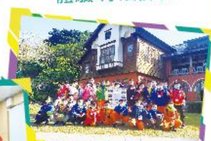
福連國小與明德國小 校際交流— 北投溫泉博物館 小小解說員