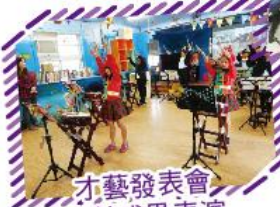
才藝發表會 太鼓成果表演