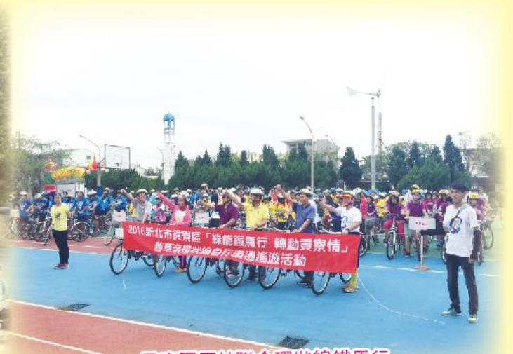
貢寮區五校聯合環狀線鐵馬行

自105學年度起，貢寮區各國小發展教師聯合共同備課，促進教師專業並接續發展混齡教學課程；108學年度起進行策略聯盟整合，共同發展英語「移地共學」課程，並聯合辦理「海墾小鐵人」、「草嶺古道健走」、「舊草嶺環狀線鐵馬行」、「豐姊姊帶你登百岳」、「六年級聯合校外教學」等學生活動，增加學生同儕互動機會，促進學生群性發展。