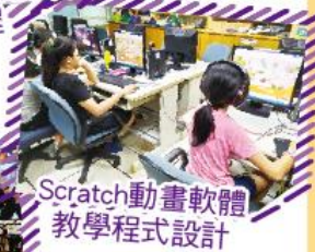
Scratch動畫軟體 教學程式設計