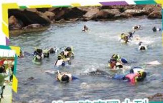
桃園陳康國小到福連國小 進行校際交流 體驗-浮潛課程