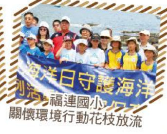
海洋日守護海洋福連國小海洋關懷環境行動花枝放流