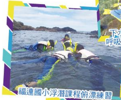
福連國小浮潛課程俯漂練習

數月的訓練，並於畢業典禮時挑戰海上小勇士泳渡卯澳灣，並無裝備下潛至3~5米深的海裡領取畢業證書，這是每位福連國小畢業生畢生難忘的回憶。