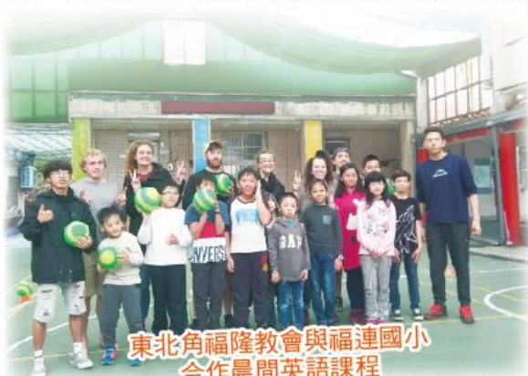
東北角福隆教會與福連國小 合作晨間英語課程 Hey,Let_s play dodgeball.

福連國小推動健康促進及閱讀推廣計畫，全校師生每週五晨間進行3公里海岸步道路跑鍛鍊好體能，並推動口腔、視力保健等健康促進行動；每日晨間推行寧靜閱讀，每週二、五大下課時間進行全校圖書借閱，並自110學年度起，推動跨校線上讀報課程，落實推動閱讀教育。