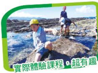
實際體驗課程，超有趣