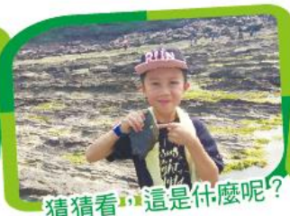
猜猜看，這是什麼呢？