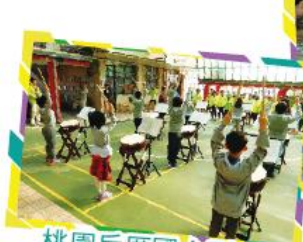
桃園后厝國小到福連國小 進行校際交流 鐵馬環島福連站

拓展學生學習視野，如：航空特色學校—桃園陳康國小、漂流相機劇展—宜蘭岳明國小、七個好習慣—蘆洲國小、腳踏車環島—桃園后厝國小、陶藝及魚菜共生—鶯歌昌福國小、明德國小—北投溫泉博物館小小解說員，均是我們交流學習的好夥伴。