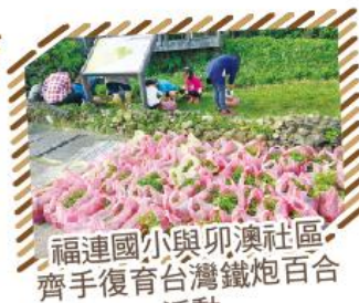
福連國小與卯澳社區齊手復育台灣鐵炮百合活動