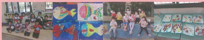
雙十帽子 彩虹魚 紙風車 釣魚遊戲

小羊 咩咩 叫，好像 在 說：「 咩咩 」 小狗 汪汪 叫，好像 在 說：「 汪汪 」 汽車 嘟嘟 ，好像 在 說：「 嘟嘟 」 時鐘 滴滴 ，好像 在 說：「 滴滴 」