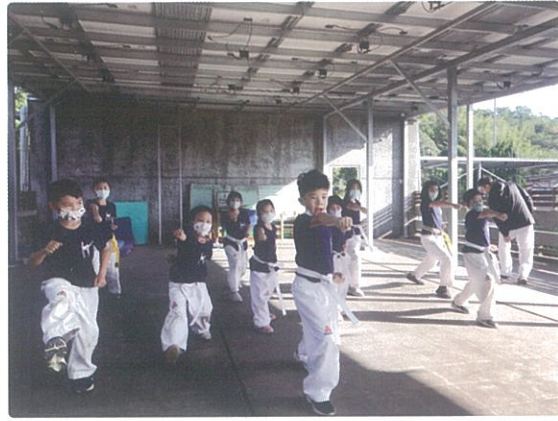
雷霆跆拳道 跆拳道鍛鍊我們的意志，柔軟我們的身形，看我威武的一面！