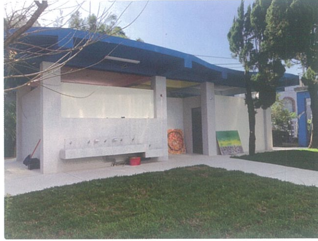
廁所拆除重建工程於9月順利完工，期望能帶給師生更舒適的如廁環境。