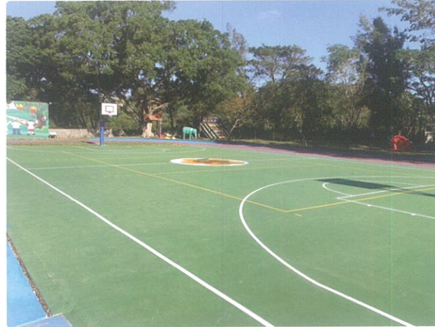
操場整建工程於9月順利完工，除了改善原有的中央球場，更鋪設了合成橡膠跑道，讓學生有安全的運動空間。