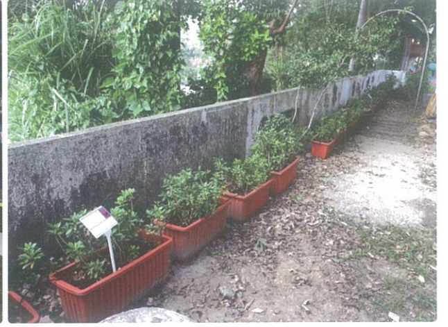
綠牆設置除淨化空氣之外，同時營造友善生態環境。